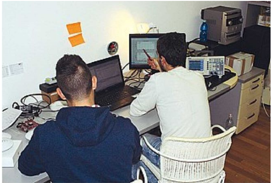
Ingegneri della sicurezza Al lavoro dentro i laboratori della I.Co dove è nato il sistema antisisma